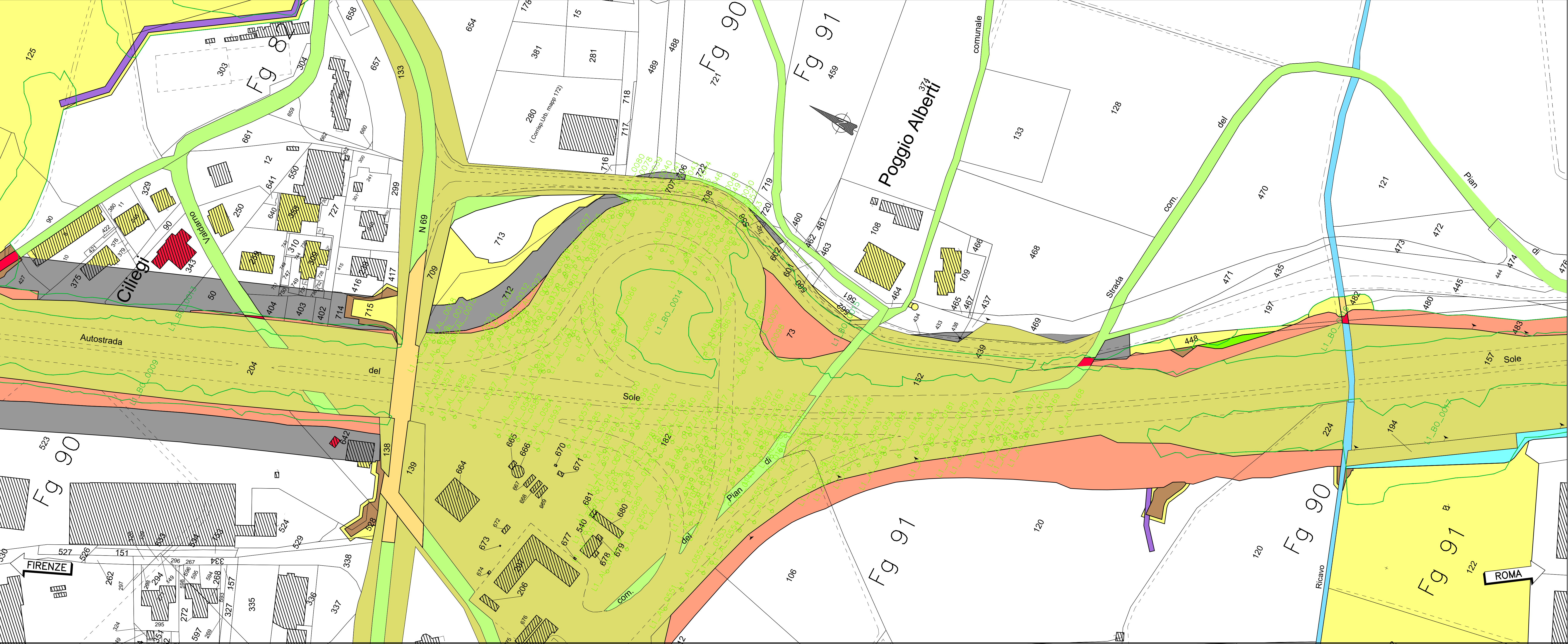
PLANIMETRIA (1:1.000) da km 319.500.00 a km 320+300.00