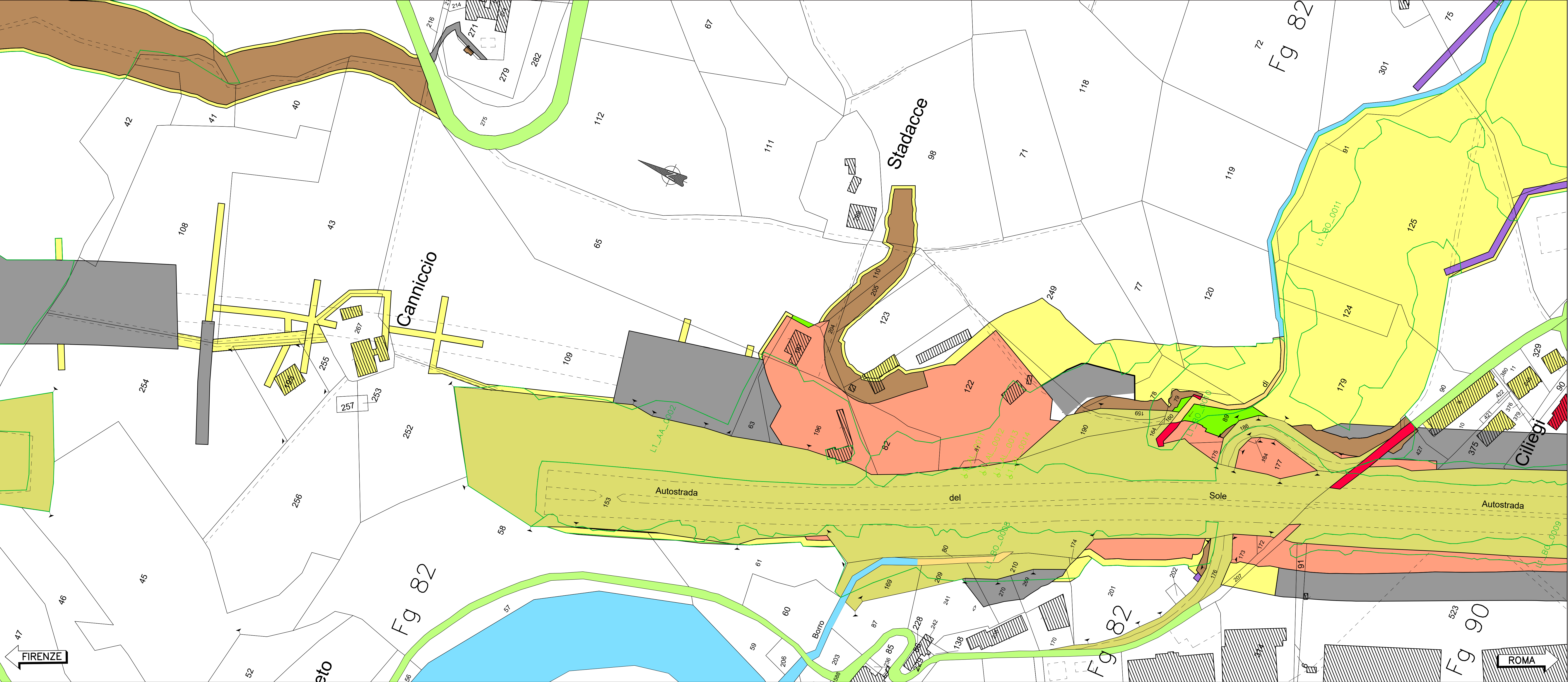
PLANIMETRIA (1:1.000) da km 318+700.00 a km 319.600.00